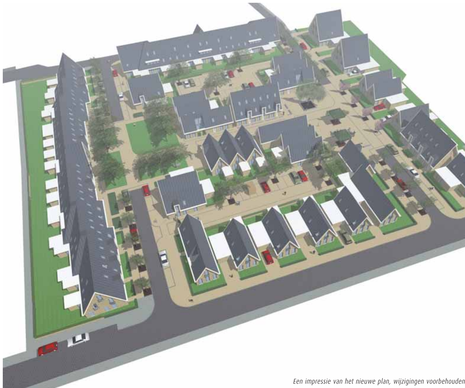
Een impressie van het nieuwe plan, wijzigingen voorbehouden.

Begin volgend jaar worden de 69 woningen aan de Valkstraat, Meerkoetstraat, Kievitstraat en Vogelzang gesloopt. Op de vrijgekomen locatie bouwt Accolade 45 huur- en 23 koopwoningen. Het nieuwe plan krijgt een dorps, knus en gezellig karakter.