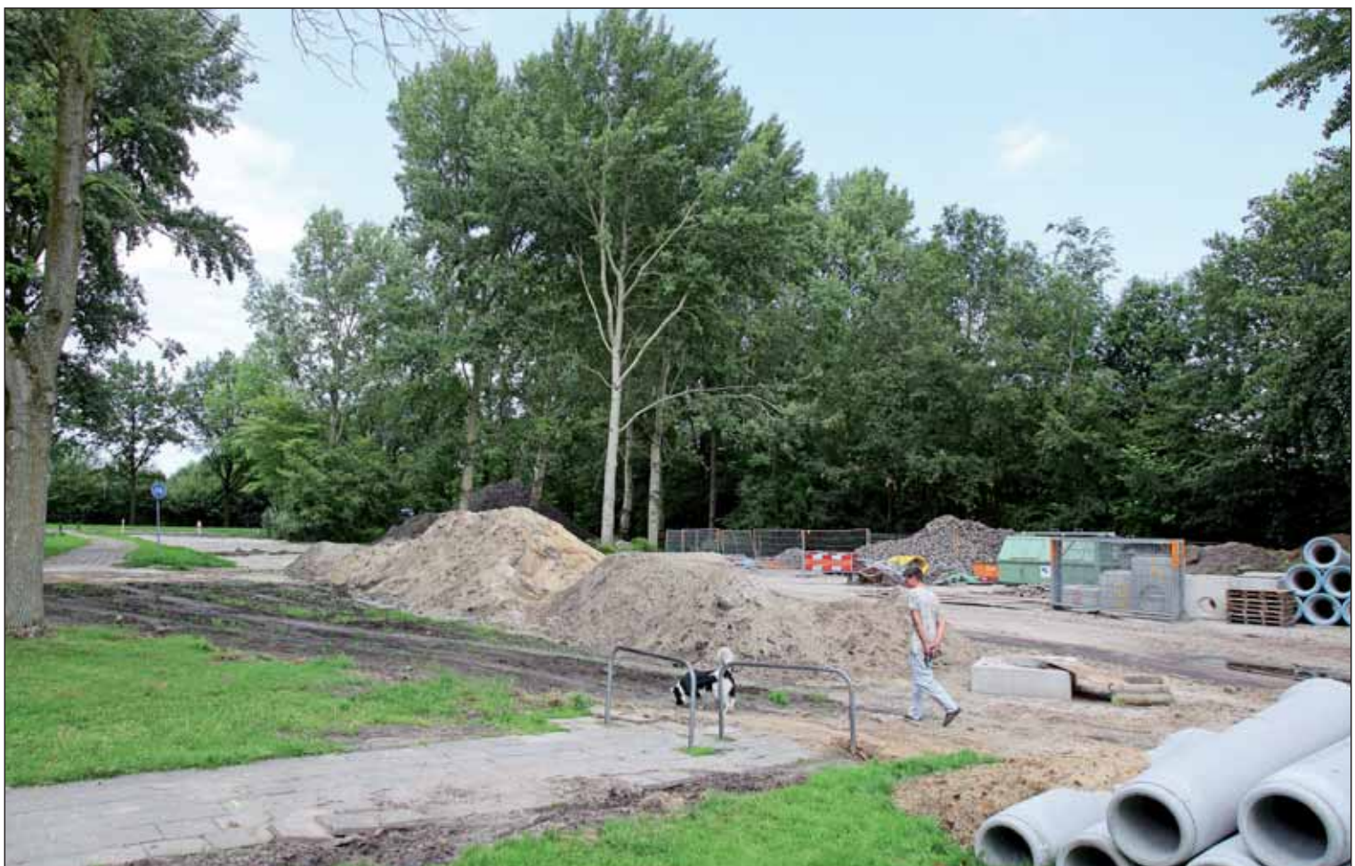
Op de foto zijn de werkzaamheden nog in volle gang, maar inmiddels is de nieuwe laan helemaal klaar. Achter de bomen ligt het voormalige rugbyterrein.

Heeft u belangstelling voor een huurwoning op het rugbyterrein? Neemt u dan contact op met Accolade Drachten. U wordt dan vrijblijvend op een belangstellendenlijst geplaatst, en tijdig geïnformeerd over de start verhuur en de te volgen procedure.