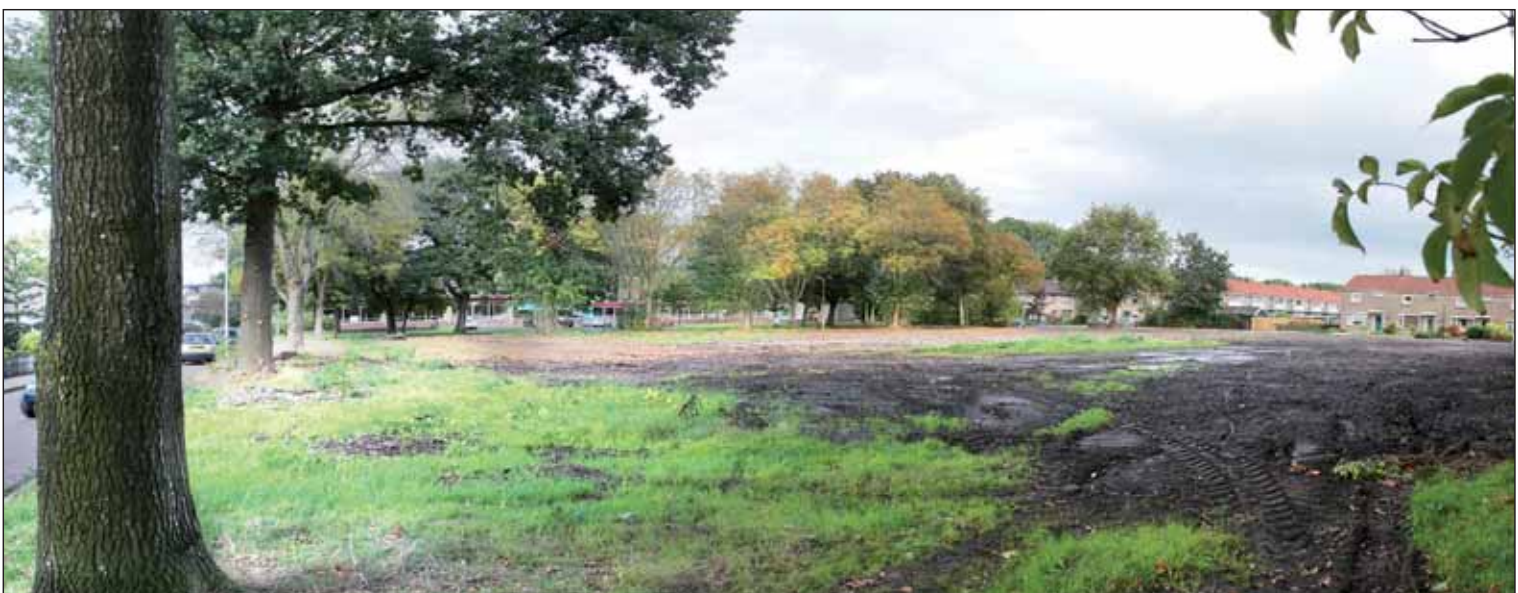
Hier wordt binnenkort gestart met de bouw van de nieuwe school en het logeerhuis