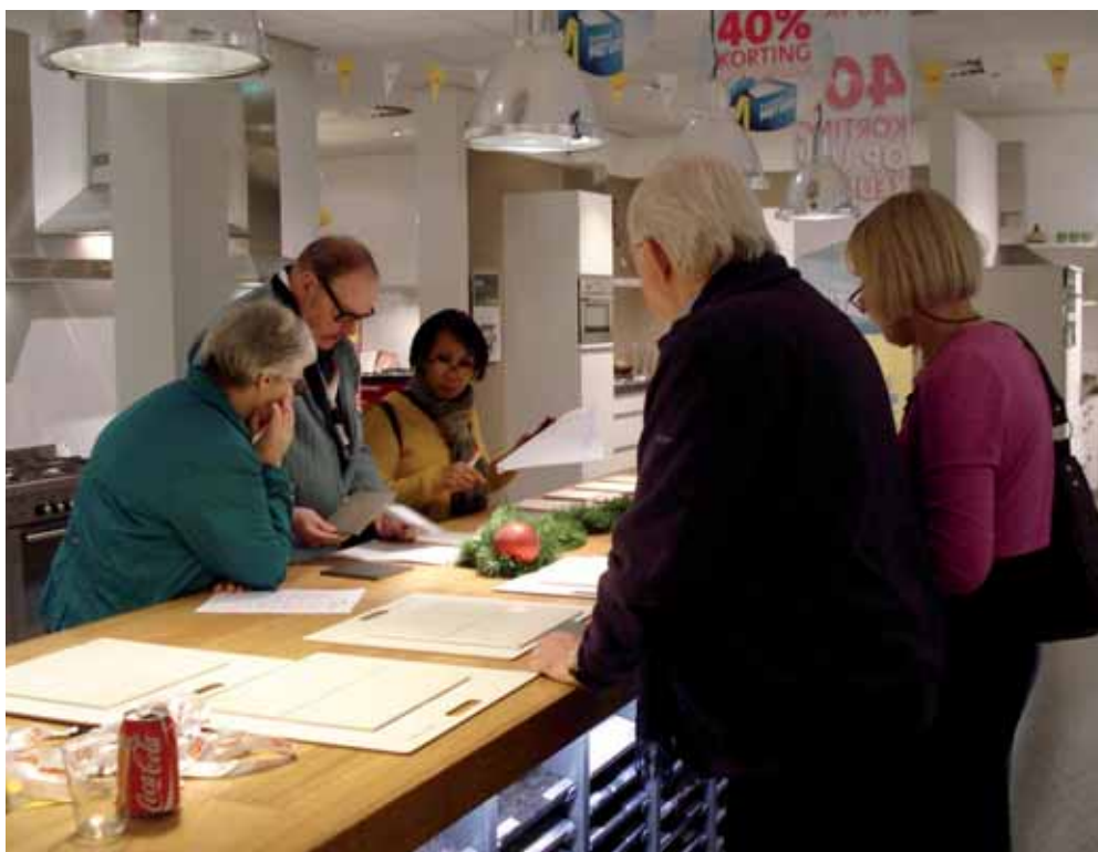
Op bezoek bij Bruynzeel Keukencentrum

In november en december hebben alle bewoners van de appartementen een bezoek gebracht aan het Bruynzeel keukencentrum. Hier konden zij een keuze maken uit verschillende keukens en wand- en vloertegels voor hun nieuwe woning. Een leuke gelegenheid om ook meteen kennis te maken met de toekomstige burens!