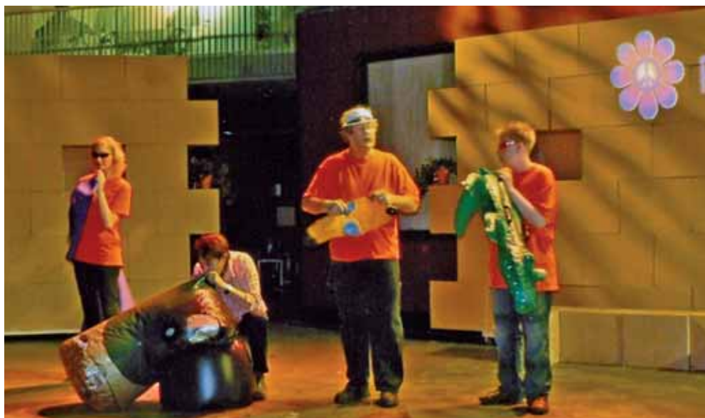
Voorstelling wijktheater 2007

Voor het uitvoeren van het sociaal programma is een budget beschikbaar gesteld. Uit dit budget worden de diverse programmaonderdelen gefinancierd. Zo is hieruit o.a. een bijdrage beschikbaar gesteld voor de aanschaf van computers in het wijkcentrum. Jong en oud kunnen