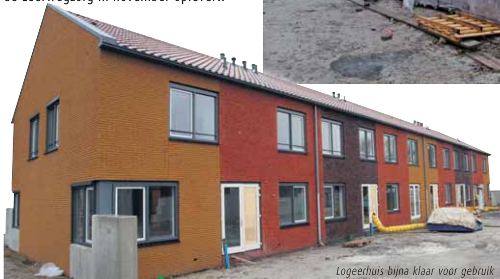
Logeerhuis bijna klaar voor gebruik

Ook hier veroorzaakte de vorst enige vertraging in bijvoorbeeld het buitenmetselwerk, het afstorten van de vloeren en het plaatsen van de staalconstructie.