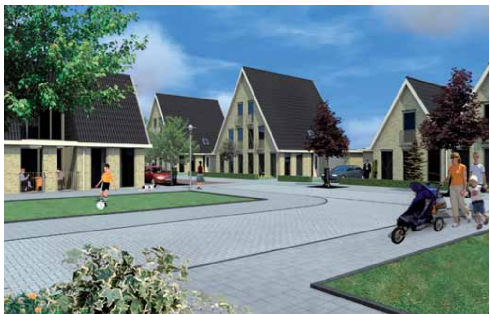
Impressie van De Lente