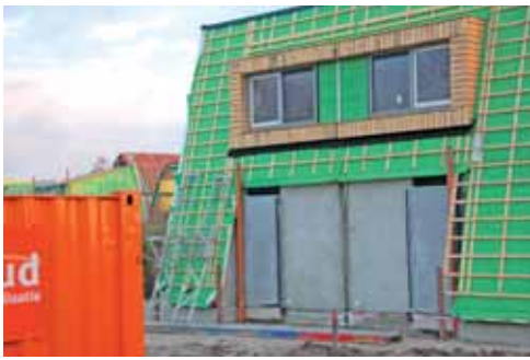
De levensloopbestendige woningen in aanbouw