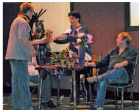
Voorstelling wijktheater 2007

Naast de bijdrage van gemeente en corporatie zal ook de huurder/eigenaar een duit in het zakje moeten doen. Dit kan bepaald worden nadat duidelijk is hoeveel mensen mee willen doen. Dit zal een substantieel deel (minimaal 75%) moeten zijn. Indien dit niet zo is dan zal het project geen doorgang kunnen vinden.