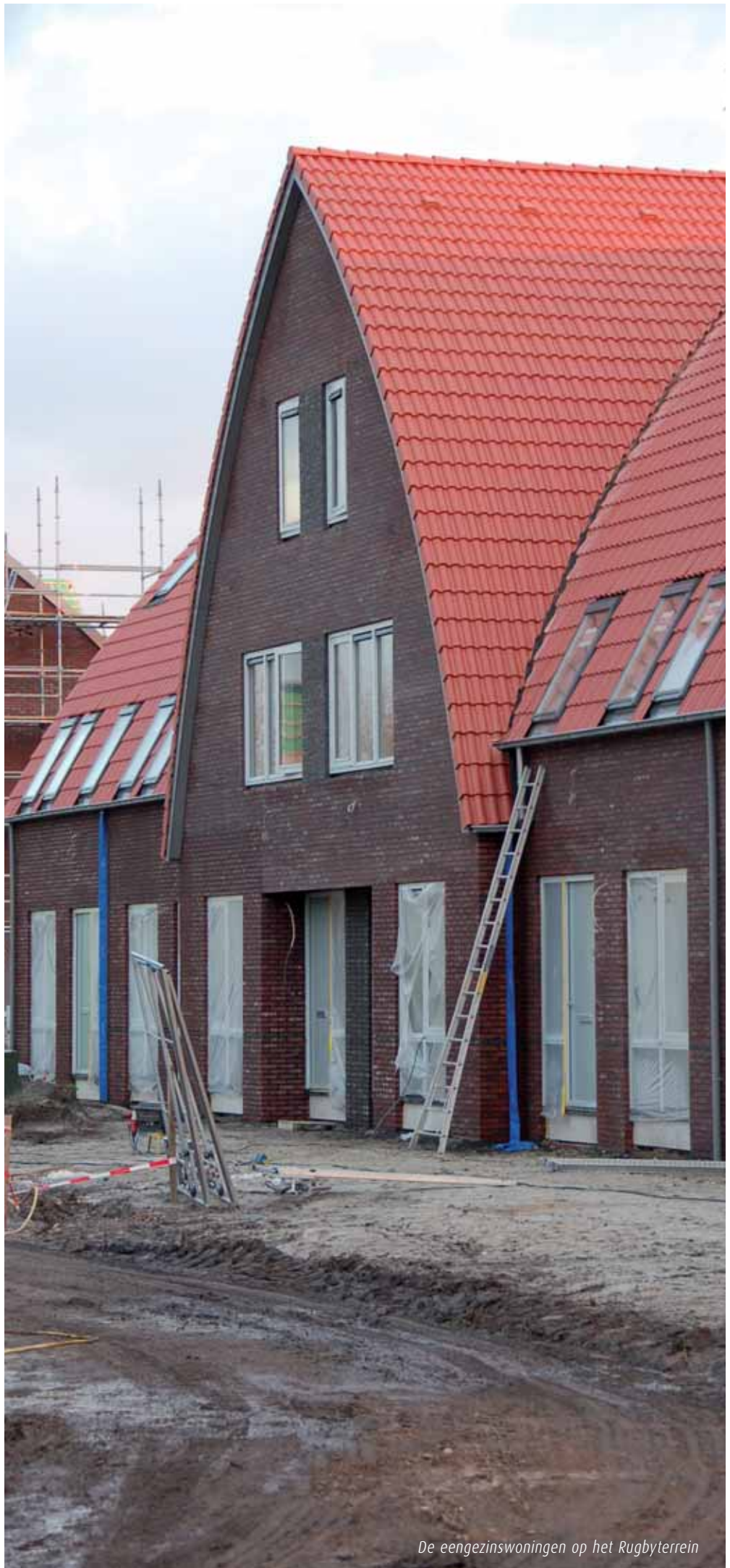
De eengezinswoningen op het Rugbyterrein