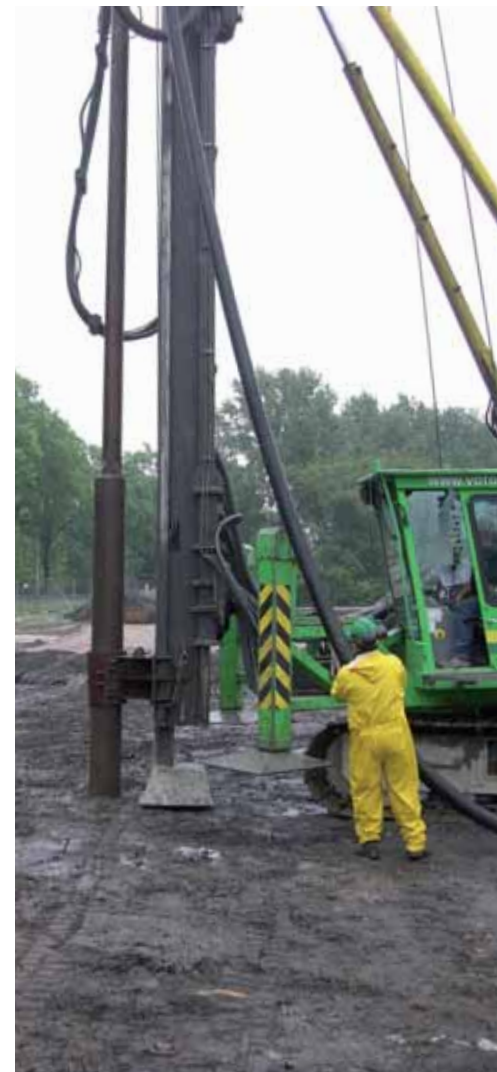
De eerste paal

De verwachting is dat de eerste eengezinswoningen in maart kunnen worden opgeleverd. Daarna volgen de patiowoningen en de appartementen. Als laatste wordt het groene middengebied met de vijverpartij aangelegd.