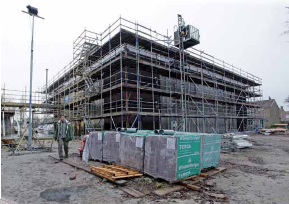
Nieuwbouw VSO Talryk

Het hoogste punt van het nieuwe Logeerhuis is inmiddels bereikt! Wanneer u langs de Harddraversdijk rijdt, kunt u zien dat het Logeerhuis al in de afbouwfase zit. Door de vorst zijn de nutsaansluitingen (gas, water en elektra) voor het Logeerhuis nog niet helemaal klaar. Hierdoor wordt de oplevering in maart verwacht. Binnenkort krijgen de omwonenden een uitnodiging om er een kijkje te nemen. De Leerwegzorg (VSO Talryk) zit nog in de ruwbouwfase. Opdrachtgever WoonFriesland verwacht het hoogste punt rond half februari (week 7) te bereiken. Verwacht wordt dat bouwbedrijf Dijkstra Draaisma uit Dokkum de Leerwegzorg in november oplevert.