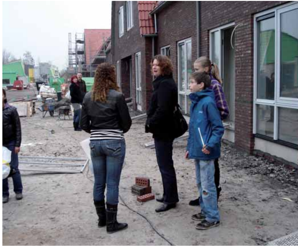
Binnen kijken in de eengezinswoningen

Wie langs het terrein komt, kan zien dat de gezinswoningen al bijna klaar zijn. Daarom nodigde Accolade de toekomstige bewoners van de gezinswoningen alvast uit om op verschillende momenten in november en december de woningen van binnen te bekijken. De woningen waren op dat moment nog in een ruwbouwfase en niet afgewerkt. Desondanks waren de nieuwe huurders zeer enthousiast. Zo waren zij zeer positief en blij verrast over de ruimte op de verdieping. Verschillende bezoekers maakten van de gelegenheid gebruik om ook in de andere woningen te kijken en kennis te maken met de nieuwe burens.