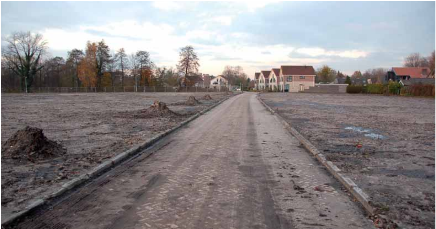
Het vlakgemaakte terrein aan de Valkstraat/Meerkoetstraat

Donderdag 30 september was de start verkoop en verhuur van 23 koop- en 45 huurwoningen van het nieuwbouwproject De Lente. Een groot succes, het was bijzonder druk in de woonwinkel van Accolade Drachten. De inschrijfperiode voor de huurwoningen is inmiddels gesloten. Meer dan tweehonderd belangstellenden hebben zich ingeschreven voor de deze woningen. Ook voor de koopwoningen was veel interesse.