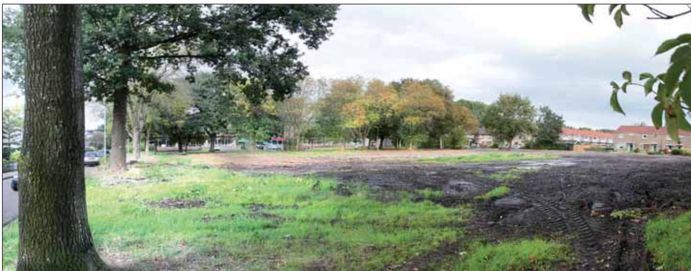
Hier wordt binnenkort gestart met de bouw van de nieuwe school en het logeershuis