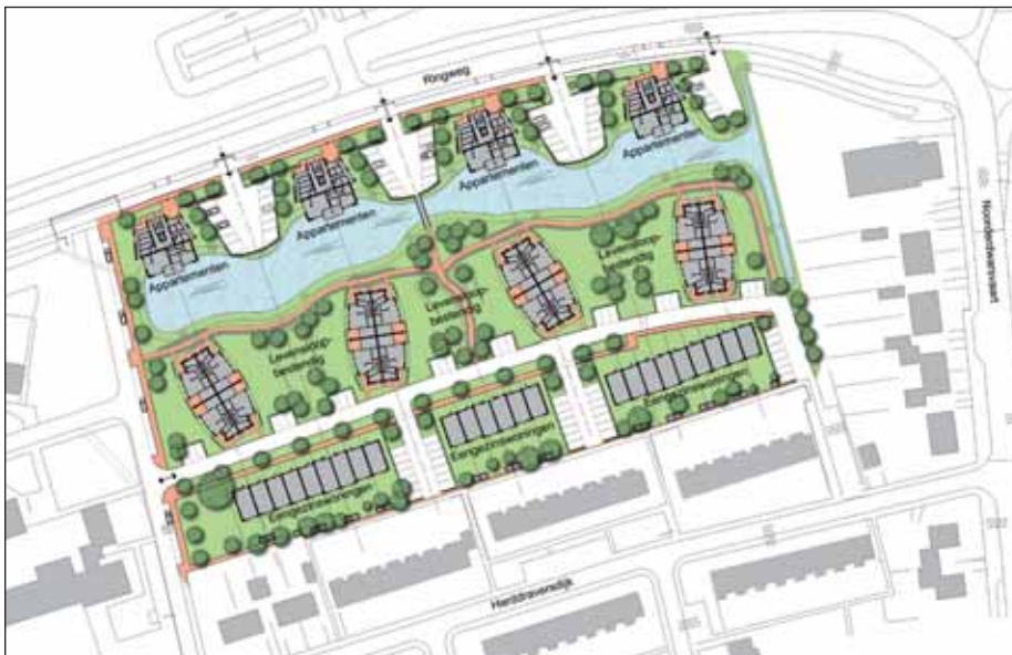
Plankaart rugbyterrein, wijzigingen voorbehouden.

Heeft u belangstelling voor een huurwoning op het rugbyterrein? Neemt u dan contact op met Accolade Drachten. U wordt dan vrijblijvend op een belangstellendenlijst geplaatst, en tijdig geïnformeerd over de start verhuur en de te volgen procedure.